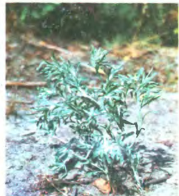
530. Сухоцвіт багновий.